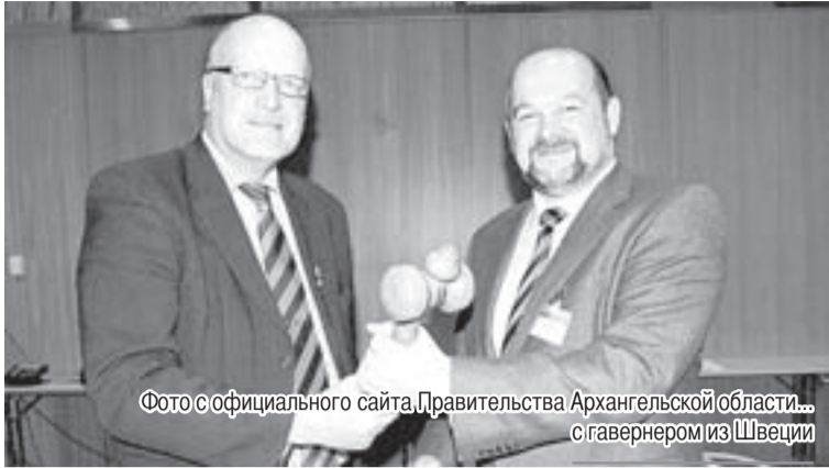
с гавернером из Швеции