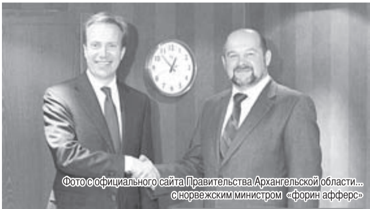
с норвежским министром «форин афферс»