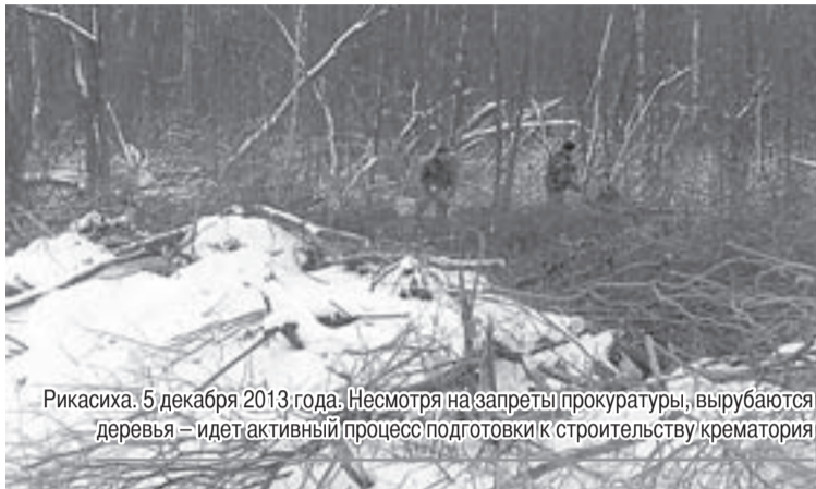
Рикасиха. 5 декабря 2013 года. Несмотря на запреты прокуратуры, вырубается деревья — идет активный процесс подготовки к строительству крематория

Инвесторами могут быть физические и юридические лица, создаваемые на основе договора о совместной деятельности и не имеющие статуса юридического лица, объединения юридических лиц, государственные органы, органы местного самоуправления, а также иностранные субъекты предприни-